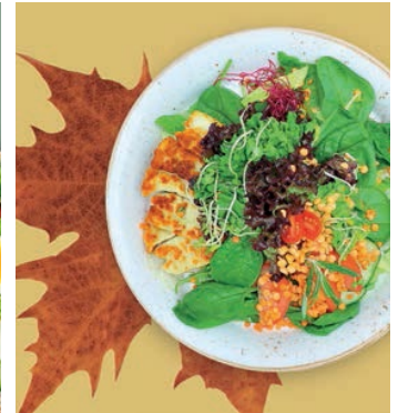
S4 4,39 €