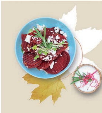
S1 0,95 €