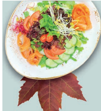
S2 4,69 €