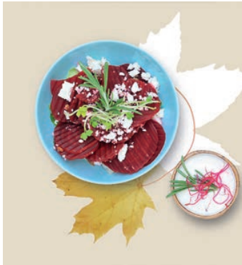
S1 0,95 €