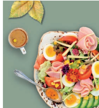
S3 4,29 €