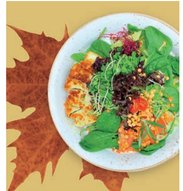
S4 4,39 €